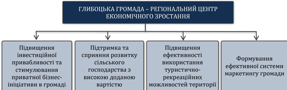
Рисунок 1. Структура цілей стратегічного напрямку 1

Більшість населення Глибоцької територіальної громади проживає у сільських населених пунктах, значна його частина зайнята у агросекторі – як підприємці, як самозайняті та як наймані працівники. З огляду на зростаючу конкуренцію в цьому секторі економіки, одним із ключових факторів успіху стає створення доданої вартості, яка в подальшому пропонується господарючими суб'єктами на ринку. Очевидно, у цьому питанні актуальною, в межах існуючих компетенцій та фінансових можливостей, є підтримка та сприяння розвитку сільського господарства з високою доданою вартістю