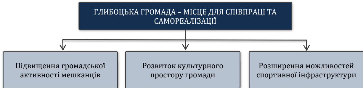
Рисунок 2. Структура цілей стратегічного напрямку 2

Успішний розвиток громади неможливий без активної участі мешканців в її щоденному житті, в ініціюванні та реалізації важливих проектів розвитку. Тому підвищення громадської активності мешканців є логічним пріоритетом в руслі трансформації Глибоцької громади у «місце для співпраці та самореалізації». Досягнення окреслених індикаторів передбачає виконання завдань, пов'язаних з запровадженням практики бюджету участі, започаткуванням практики організації та/або стимулювання громадських ініціатив, проектів, пов'язаних з патріотичним вихованням дітей та місцевої молоді.