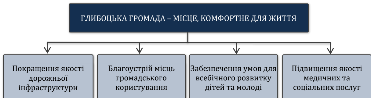
Рисунок 3. Структура цілей стратегічного напрямку 3

Логіка досягнення стратегічного цілі « Глибоцька громада – місце, комфортне для життя » розкривається через такі операційні напрямки (рис. 4).